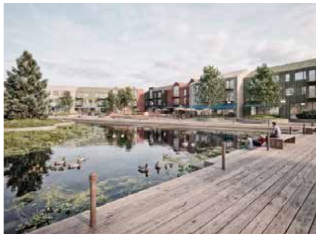
Útivistarsvæðið, tjörn að sumri, skautasvell á veturna.