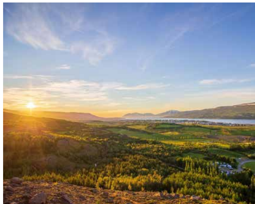
Unnið er að nýrri aðkomu að Hömrum þar sem gert er ráð fyrir einstefnukerfi um svæðið