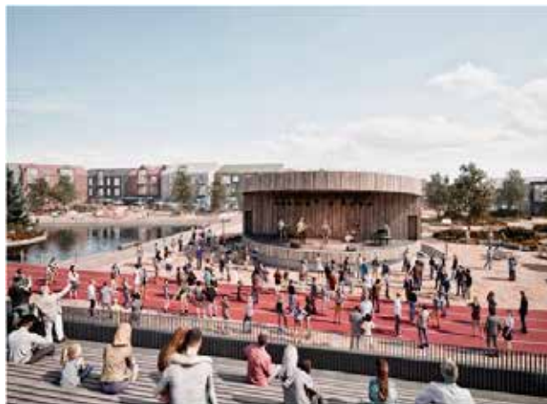
Sviðið og stúkan til hægri en til vinstri má sjá boltavöll sem einnig getur verið matkaðstorg.