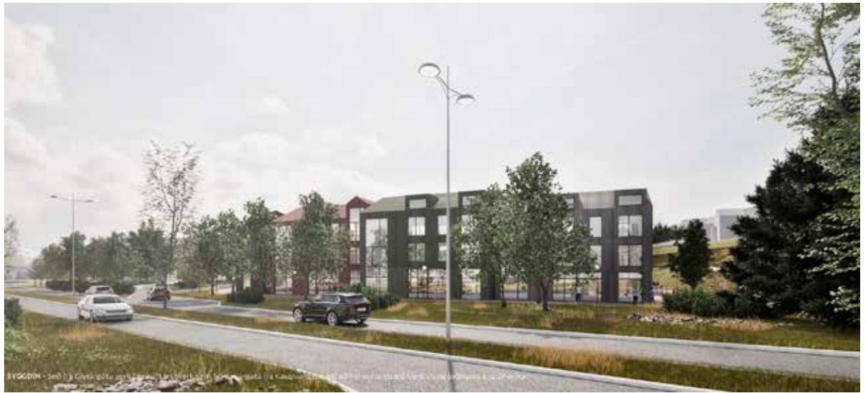
Hér er horft á nýja svæðið frá Glerárgötu.