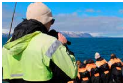
Hápunktur hvalaskólans er fyrir mörgum, hvalaskoðun um Skjálfaflóa.

Þá hefur Hvalaskólinn verið starfræktur sem samstarfsverkefni Hvalasafnsins á Húsavík, Norðursiglingar, Borgarhólsskóla og