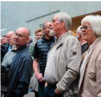
Fjölmarginir lögðu leið sína í Hof til að skoða þær tillögur sem bárust í samkeppni um skipulag Akureyrarvallar.

Heildarfjöldi íbúða á skipulagssvæðinu er áætlaður allt að 65-70 talsins. Í Austur og Vesturklasa verða á bilinu 50 til 55 íbúðir. Fjöldi íbúða í tvíbýlis/fjórbylishúsum við Smáragötu og Hólabraut er 12 talsins og þá er gert ráð fyrir þremur einbýlishúsum við Brekkugötu. Mögulegt er að bæta við 3 einbýlishúsalóðum við Brekkugötu.