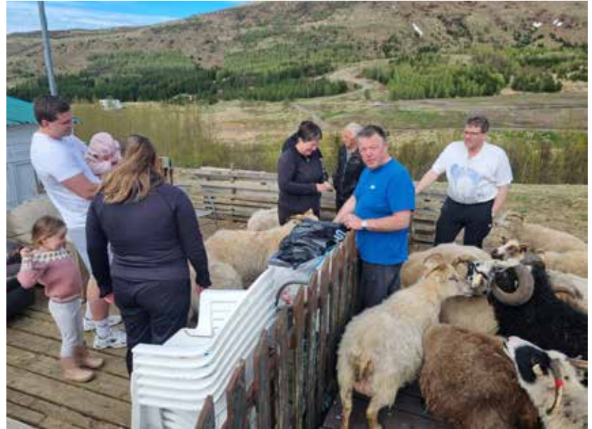
Það er búið að vera gestkvæmt þetta vorið í Grobbholti.

„Það er allskonar fólk að mæta, 90 prósent mæta bara án þess að gera boð á undan sér en svo eru